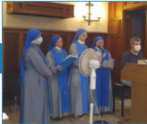
6 de agosto. Fiesta de la Transfiguración del Señor. Parroquia de San Salvador de la Marina. (San Telmo)