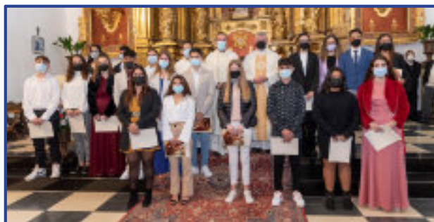
CONFIRMACIONES en la Parroquia de Santa Eulalia (arriba) y de San Salvador de la Marina (abajo).

Siendo muy importante la familia de sangre, Jesús hace la primera presentación de una familia más amplia, la familia de Dios. Más tarde dirá: “¿quién es mi madre y mis hermanos? Los que escuchan la palabra de Dios y la ponen en práctica.” En cuanto creyentes, María y José maduran su fe en medio de perplejidades, angustias y gozos. Las cosas se irán aclarando poco a poco. No es fácil entender los planes de Dios. Ni siquiera María los entiende.