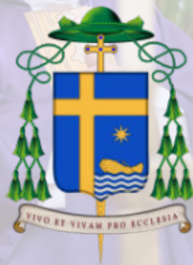
El escudo episcopal

“Vivo y viviré por la Iglesia.” Estas palabras de beato Francisco Palau i Quer [Mis relaciones (744, 29)] son las que he elegido para mi lema episcopal. Con ellas me identifico, con ellas me defino, y con ellas quiero expresar lo que es y será mi ministerio episcopal. Y con ellas quiero referirme a mi presente como obispo de esta querida diócesis de Ibiza y Formentera y a mi futuro, pues el mismo padre Palau dice de sí: Vivo y viviré por la Iglesia; vivo y moriré por ella. También yo, después de un presente incondicional en el que ni un solo día deje de decir ni de poner en práctica que vivo por la Iglesia, pueda decir: y moriré por ella y en ella.