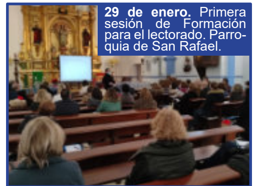
29 de enero. Primera sesión de Formación para el lectorado. Parroquia de San Rafael.