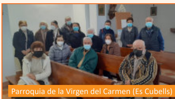
Parroquia de la Virgen del Carmen (Es Cubells)

En las fotos: continúan las reuniones sinodales en las parroquias y en las instituciones.