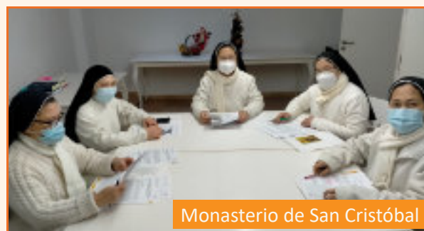
Monasterio de San Cristóbal