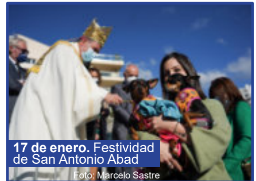
17 de enero. Festividad de San Antonio Abad