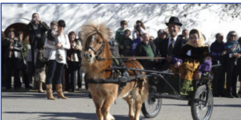
21 de enero. En la festividad de la Parroquia de Santa Inés, se celebró una eucaristía solemne presidida por el obispo de Ibiza. Tras la misma, se salió en procesión encabezada por la bandera parroquial la cual Mons. Vicent Ribas bendijo durante la misa.

Misa Solemne de la familia: domingo 20 a las 12h. en la S.I. Catedral de Ibiza.