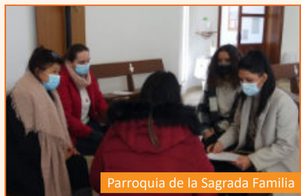
Parroquia de la Sagrada Familia