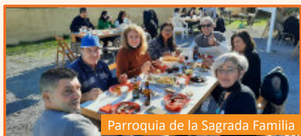
Parroquia de la Sagrada Familia