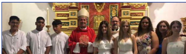
9 de julio. Un grupo de jóvenes recibe el Sacramento de la Confirmación en la Parroquia de San Antonio