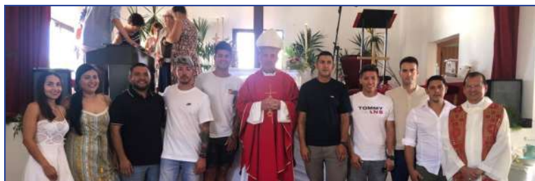
10 de julio. Un grupo de jóvenes recibe el Sacramento de la Confirmación en la Parroquia de San Fernando (Formentera)