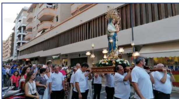
29, 30 y 31 de julio. Triduo en honor a Ntra. Sra. la Virgen de las Nieves. El primer día se celebró en la Parroquia del Rosario, con posterior traslado hasta la Parroquia de Santa Cruz. El segundo día se celebró en Santa Cruz, con posterior traslado hasta la Parroquia de San Telmo, y el tercer día se celebró en la Parroquia de San Telmo. En las fotos, la Virgen peregrina por las calles de la Ciudad.