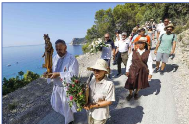
17 de julio. Procesión de la Virgen del Carmen en Es Cubells. En la foto, momento en el que se dirigen al mar con la imagen para subirla a la barca.