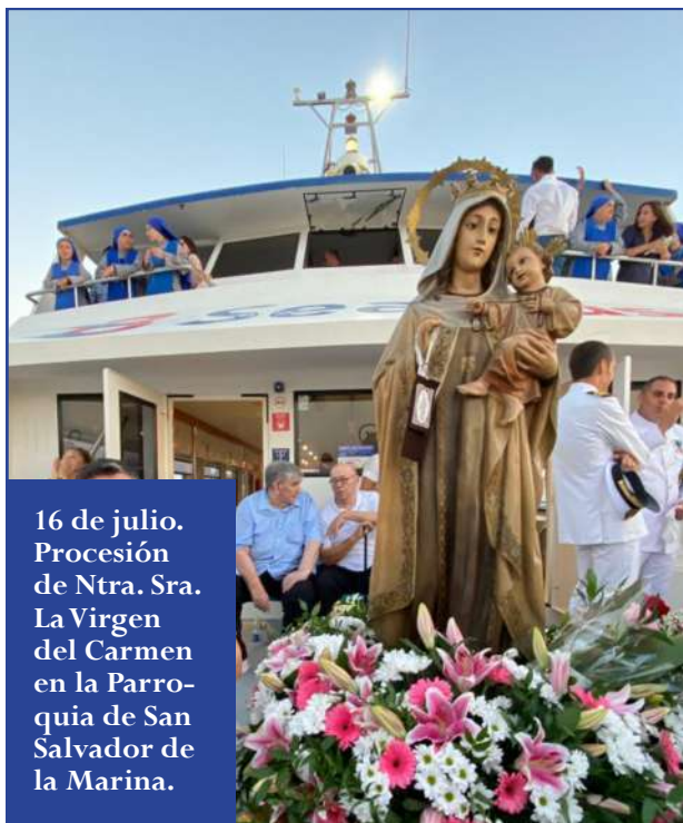
16 de julio. Procesión de Ntra. Sra. La Virgen del Carmen en la Parroquia de San Salvador de la Marina.