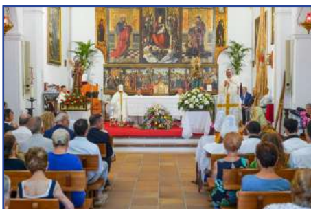
8 de septiembre. Festividad de la Parroquia de Ntra. Sra. de Jesús.

26 de septiembre. La Parroquia de Sant Jordi organizó una comida solidaria a beneficio de AEMIF (Asociación de Esclerosis Múltiple de Ibiza y Formentera).