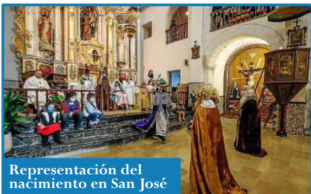
Representación del nacimiento en San José