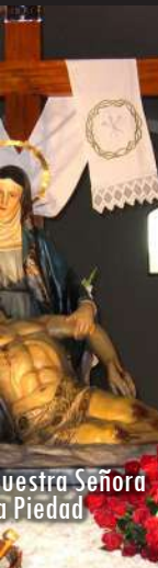
Nuestra Señora de la Piedad