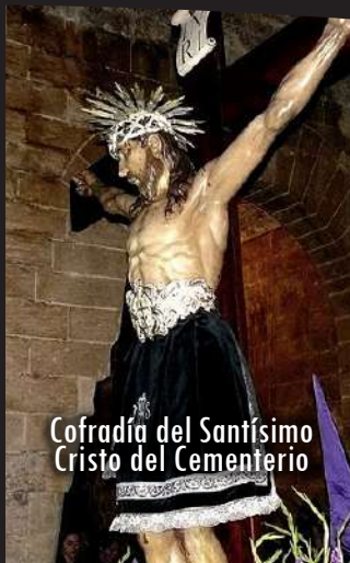
Cofradía del Santísimo Cristo del Cementerio