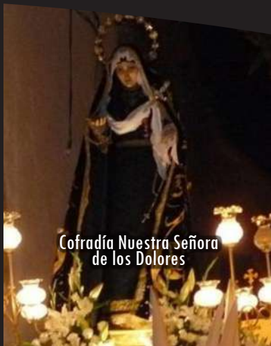
Cofradía Nuestra Señora de los Dolores