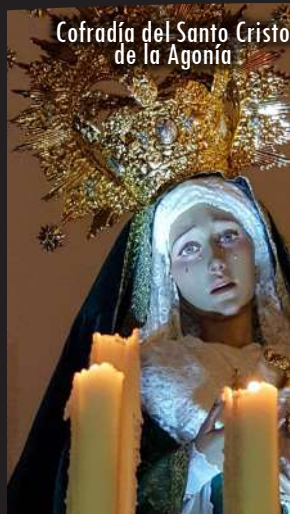
Cofradía del Santo Cristo de la Agonía