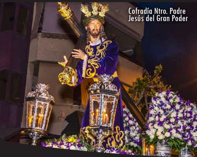
Cofradía Ntro. Padre Jesús del Gran Poder