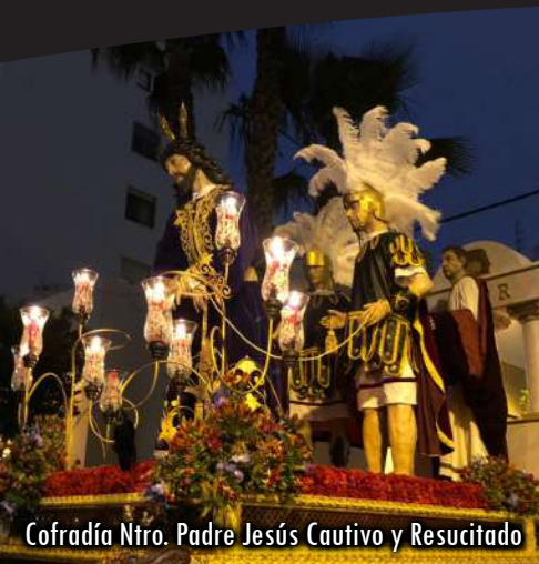
Cofradía Ntro. Padre Jesús Cautivo y Resucitado