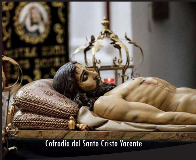
Cofradía del Santo Cristo Yacente