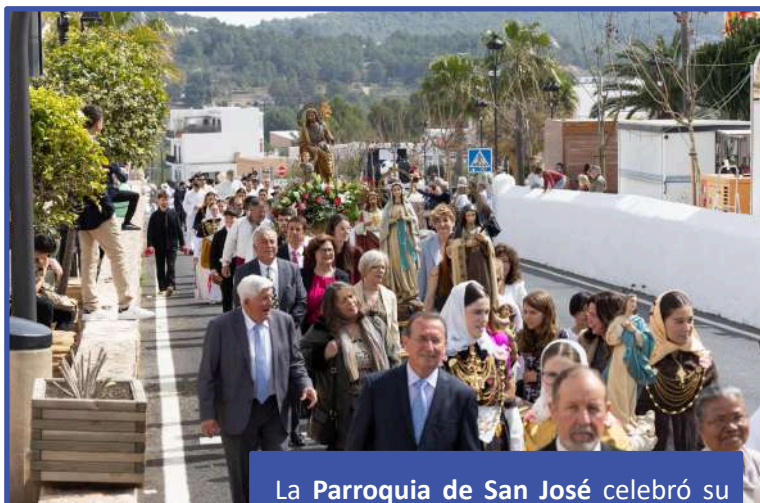
La Parroquia de San José celebró su gran día con una Misa Solemne presidida por nuestro Obispo, seguida de una procesión por las calles del municipio con las imágenes de los santos.