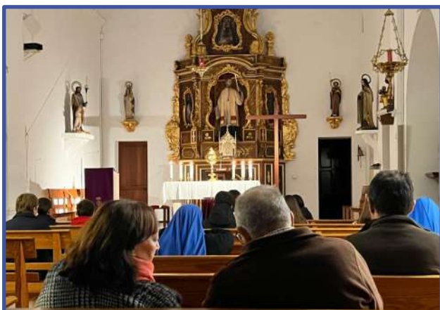
La Diócesis celebró las 24 horas para el Señor , la iniciativa cuaresmal de oración y reconciliación instituida por voluntad del Papa Francisco . En Ibiza tuvo lugar la celebración en la Parroquia de Santa Cruz y en Formentera (foto), en la Parroquia de San Fernando .