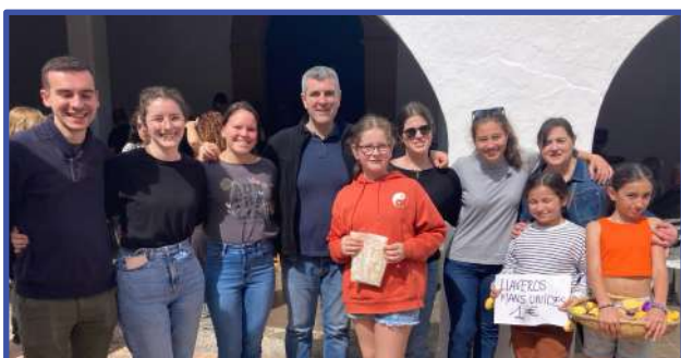
Jóvenes voluntarios de MANOS UNIDAS Ibiza, ayudaron a servir en la comida organizada por la Delegación en la Parroquia de Sant Josep el domingo 17 de marzo.