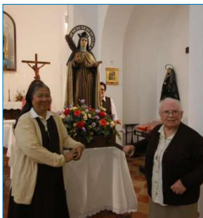
Celebración de Santa Teresa. Es Cubells.