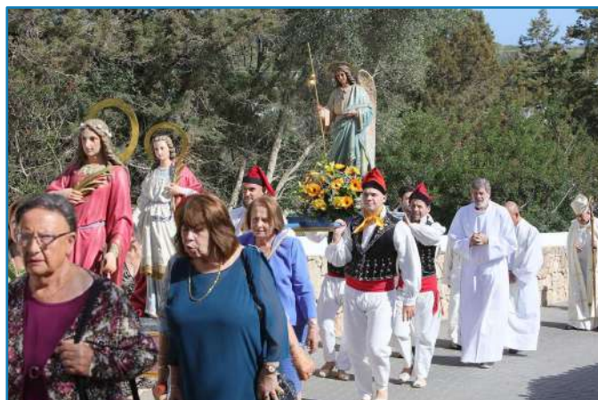
Procesión con el Santo Arcángel. Parroquia San Rafael.