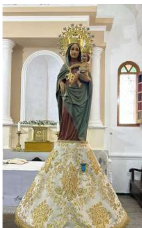
Celebración de Virgen del Pilar. (Formentera)