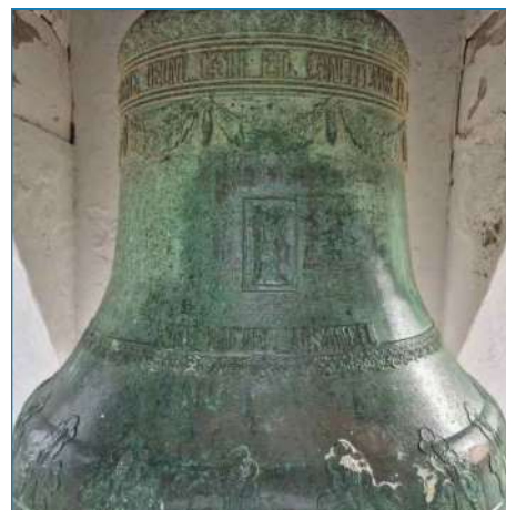
Detalle de la campana con la inscripción conmemorativa y otros dibujos grabados en el bronce

Posteriormente, en 1956, el campanario de 1900 fue reformado hasta darle la forma que tiene en la actualidad, aunque manteniendo la misma campana.