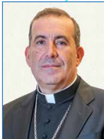
† Vicente Ribas Prats Obispo de Ibiza y Formentera

Presentar y anunciar a Jesucristo como único mediador entre el amor del Padre y las necesidades más profundas de los hombres y mujeres es la misión a la que estamos llamados para construir entre todos una sociedad cada día más justa, más respetuosa, más humana, más de todos, más de Dios.