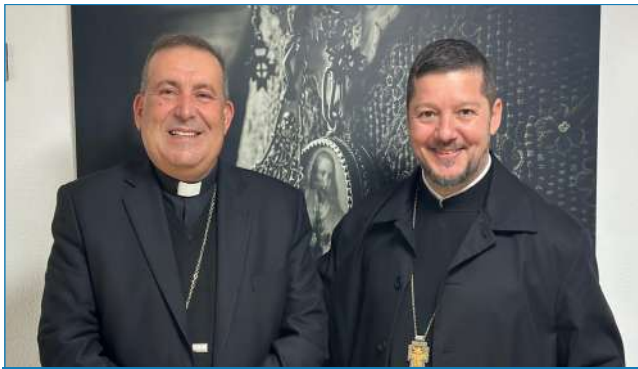
El arzobispo metropolitano ortodoxo de España y Portugal, Bessarion Spyridon Komzias, hizo una visita de cortesía al obispo de Ibiza, Mons. Vicent Ribas, aprovechando el viaje que ha efectuado a la isla.