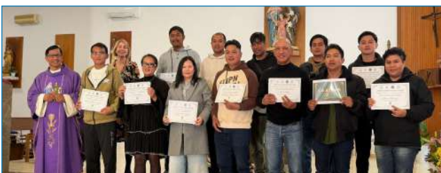
Un total de 14 alumnos han finalizado con éxito el curso básico de idioma castellano organizado por la delegación de migraciones y Cáritas. Esta iniciativa ha permitido a los participantes mejorar sus habilidades lingüísticas, facilitando así su integración social y acceso a nuevas oportunidades.