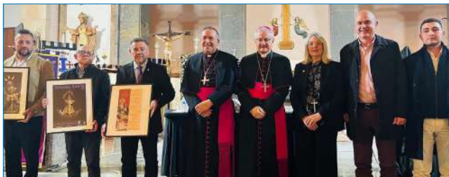
El 6 de marzo tuvo lugar el Pregón Diocesano de la Semana Santa 2026 y la presentación de los carteles de la ciudad de Ibiza, Santa Eulària y Formentera.